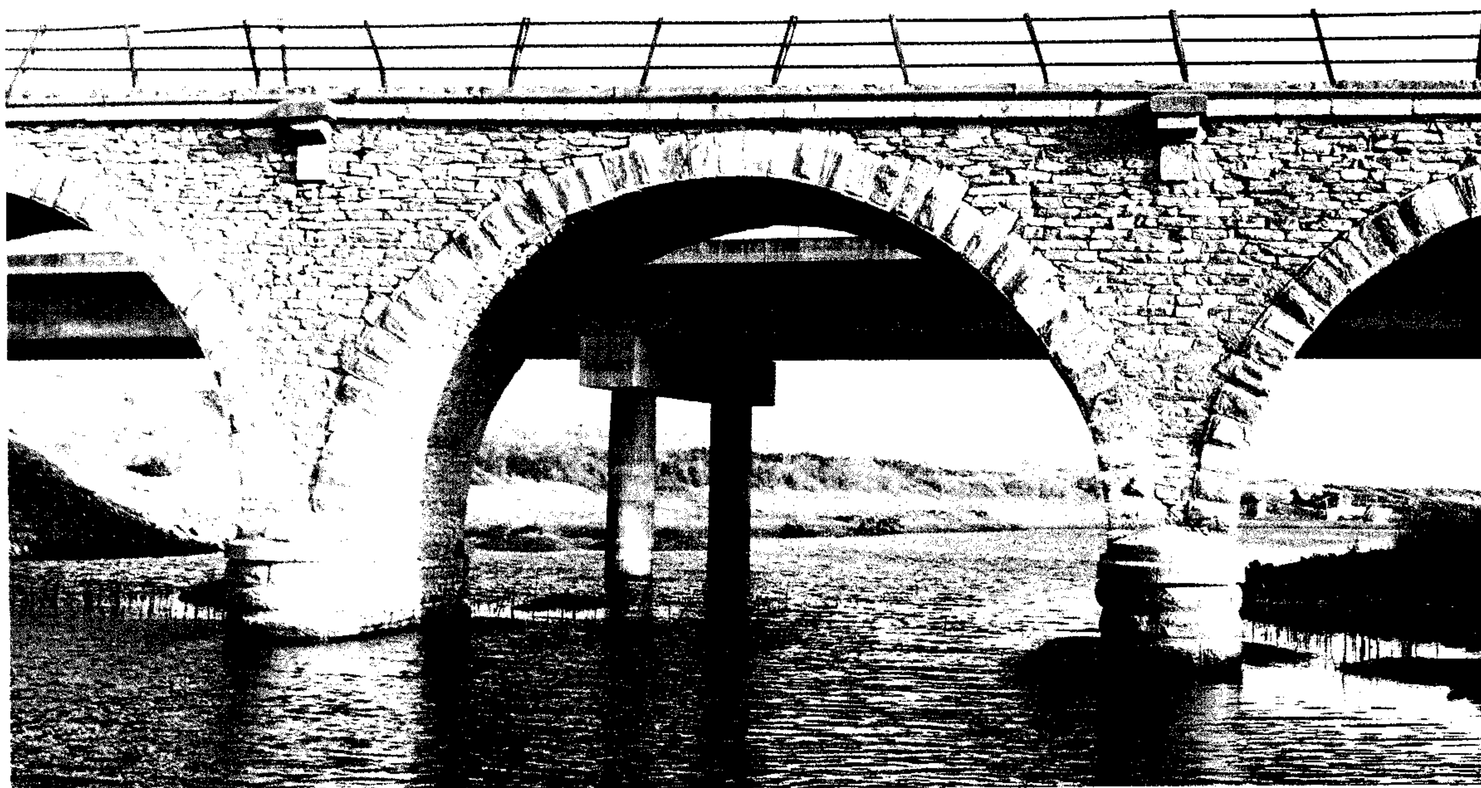
Το γεφύρι στο Ασμάκι χτίσθηκε στα τέλη του 19ου αιώνα