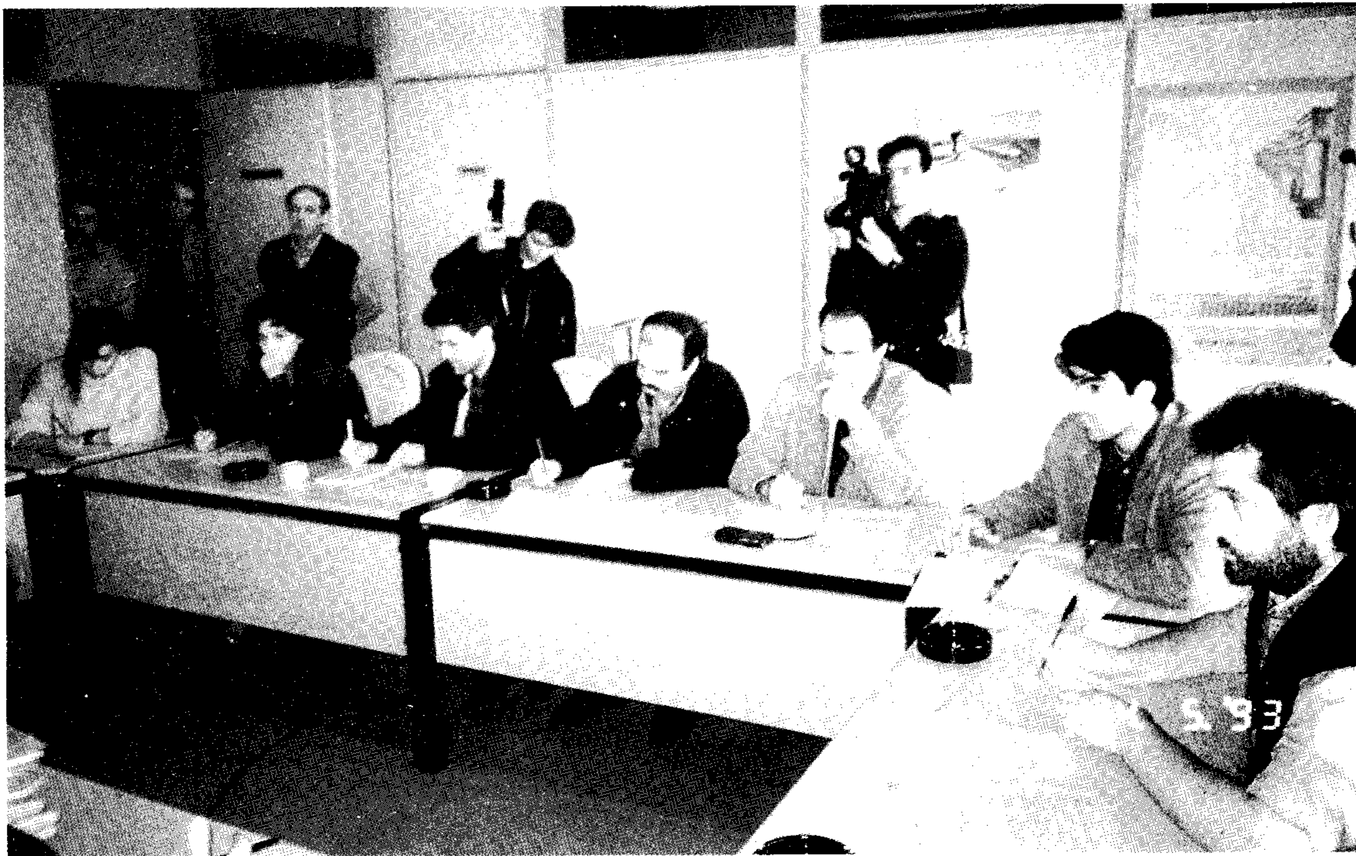
Το έντονο ενδιαφέρον του τοπικού γραπτού και ηλεκτρονικού Τύπου καθώς και των ανταποκριτών των αθηναϊκών εφημερίδων προκάλεσε η συνέντευξη του ΤΕΕ για τον Αχελώο.

Πιστεύουμε ότι αυτό αποτελεί εμπαιγμό προς τους Φορείς και το λαό της Θεσσαλίας και μας κάνει να διατηρούμε πλέον σοβαρές επιφυλάξεις, για το κατά