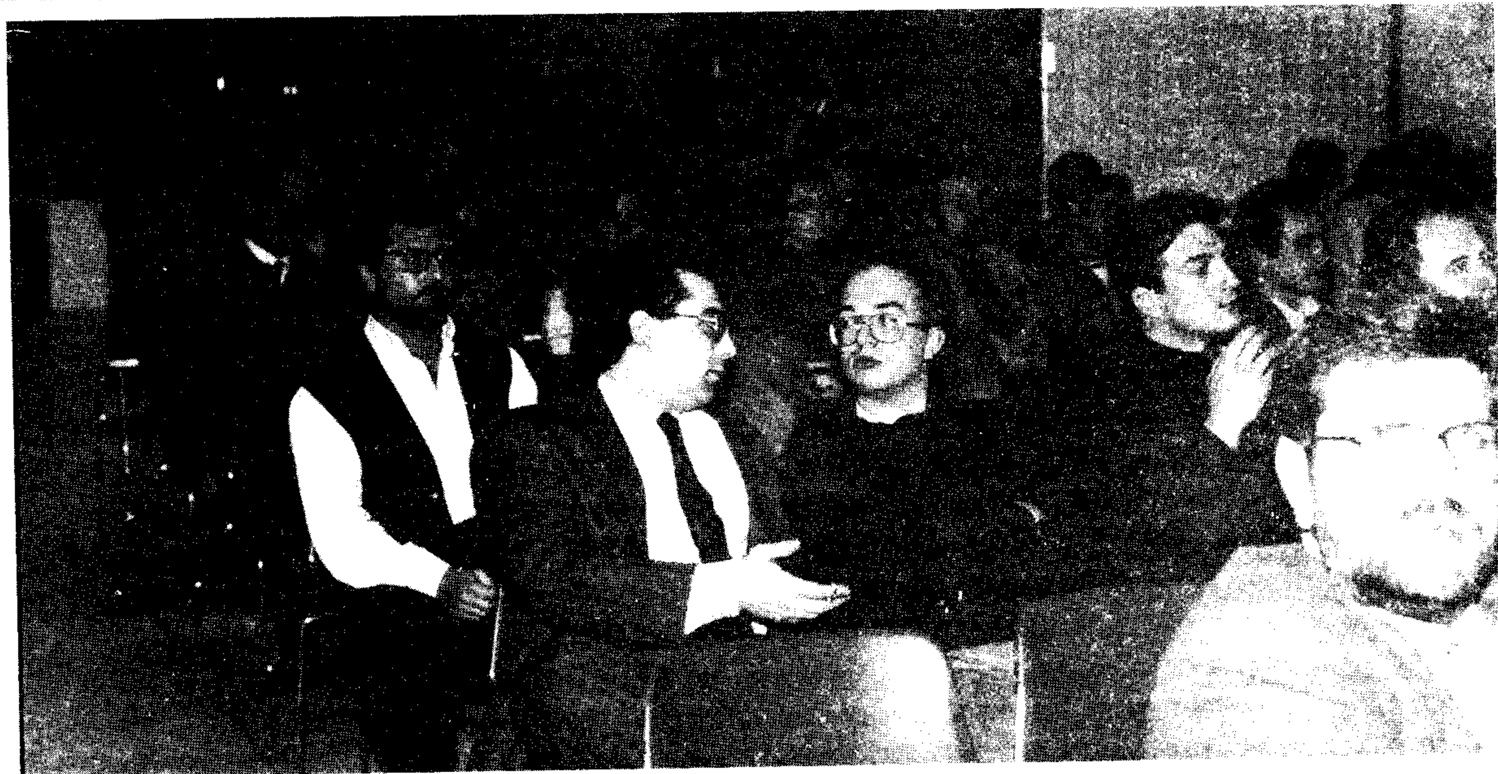
Μέχρι και στα πίσω καθίσματα υπήρχαν συνάδελφοι στην εκδήλωση κοπής της πίττας